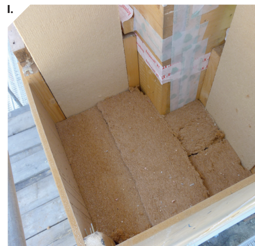
I. VUE DE L'ISOLATION (AVANT REMPLISSAGE AVEC DE LA CELLULOSE).